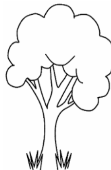
podzim- barevné listy