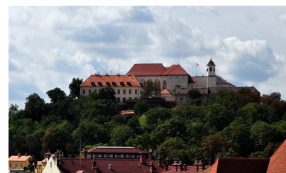
hrad Špilberk v Brně