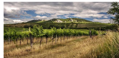
Pálava s vinohrady

Města : Znojmo, Mikulov, Břeclav, Vyškov, Hodonín Průmysl : potravinářský, těžební, strojírenský Zemědělství : obiloviny, vinná réva, ovoce, zelenina, řepa cukr chov ryb, prasat, drůbeže