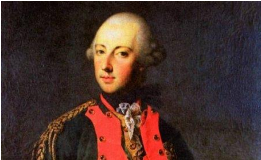
Císař Josef II ( 1741 – 1790)

Mezi její největší zásluhy však patří, že zavedla povinnou šestiletou školní docházku od 6 do 12 let. Všechny děti se tak naučily číst, psát, počítat a byly vedeny ke slušnému chování.