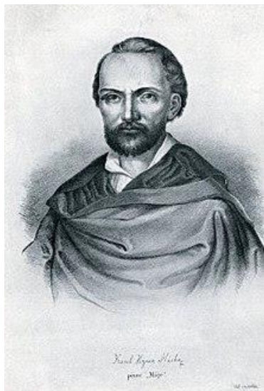
Karel Hynek Mácha ( 1810 – 1836)

V kultuře a umění vznikl nový umělecký směr ROMANTISMUS = návrat k přírodě a lidem. Hrdinové uměleckých děl byli zbojníci, vězni, žebráci, tuláci. V české literatuře vynikl básník Karel Hynek Mácha se svou básní MÁJ . V hudbě se skladatelé oper nechali unést pohádkovými a dobrodružnými náměty.